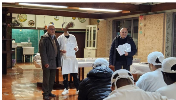
L'aula presso la sede di Solco srl