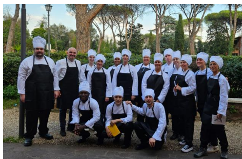
La classe presso l'IPSEOA Tor Carbone