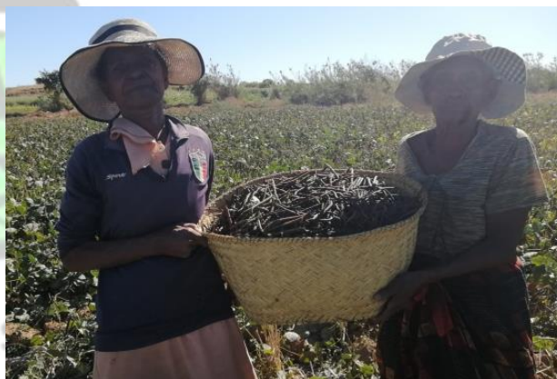
Momenti del lavoro dei campi