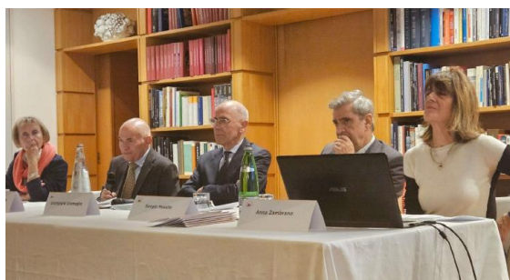
Il tavolo dei relatori

Hanno partecipato rappresentanti di diverse organizzazioni che lavorano nel volontariato, nella formazione e nella promozione dell'inclusione sociale di persone appartenenti a categorie vulnerabili.