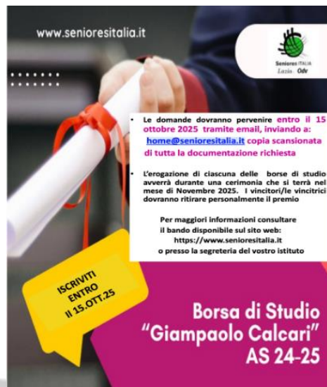
Il bando per le 3 borse di studio