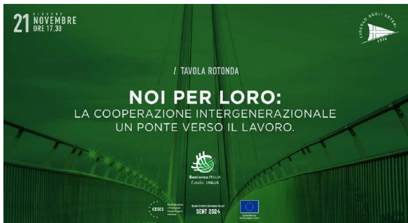
Il manifesto dell'evento

Il workshop si è tenuto il 21 novembre presso il Circolo degli Esteri.