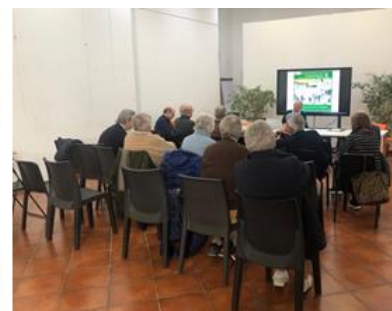
Immagine della sala dove si è svolto il Caffè del 2 dicembre