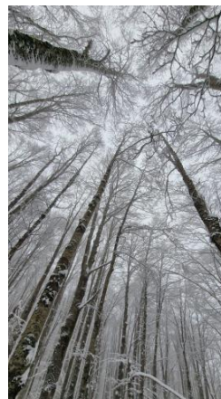
due esempi delle immagine condivise

IL CAFFÈ DEI SENIORES - Il 2 dicembre 2024, alle 10:30, presso la Casa del Volontariato del Comune di Roma in via Galilei 53, si è tenuto un interessante Caffè dei Seniores.