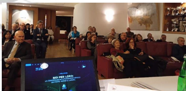
La sala al Circolo degli Esteri

Nei vari interventi sono state analizzate le molteplici barriere che impediscono il dialogo intergenerazionale, come trasferire le preziose competenze dei Senior alle giovani generazioni che incontrano notevoli difficoltà nell'adattarsi ai nuovi, attraenti ma impegnativi orizzonti di vita, sia nei Paesi d'origine che nei nuovi Paesi di accoglienza.