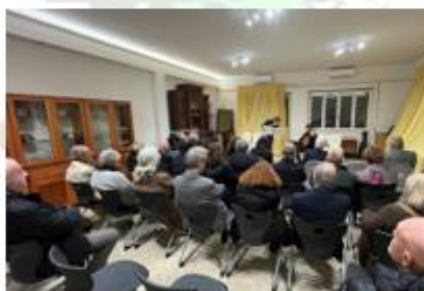
Immagini del concerto

La brigata di cucina dell'IPSEOA Tor Carbone composta da studenti delle 3 sedi: Tor Carbone, Elsa Morante e Via Argoli