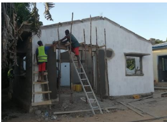
Il magazzino in fase di ultimazione